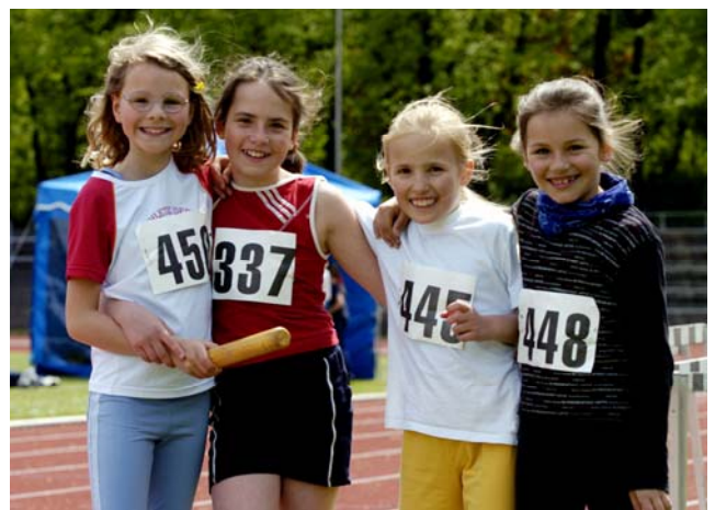
die 4x50m Staffel mit Alessa+Sophie+Vici+Sarah

800 m Lauf (3 Teilnehmer) 3. Termignon, M 2:57,47 min