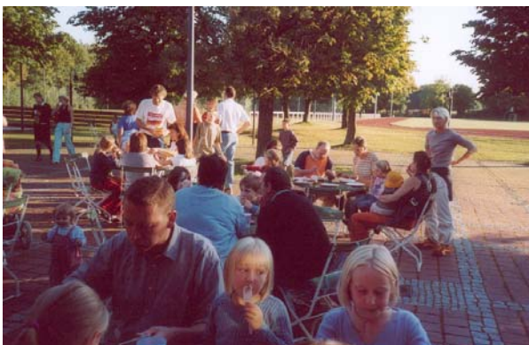
Grillfest am 13. September beim Sport- und Bürgerzentrum

Nach dem Ende der Ferien traf sich die Abteilung am 13. September wieder zu ihrem traditionellen Grillfest auf dem Sportplatz. Über 80 Kinder und Eltern waren bei herrlichen Spätsommerwetter zum Sport- und Bürgerzentrum gekommen und der Andrang auf Essen und Getränke war groß.